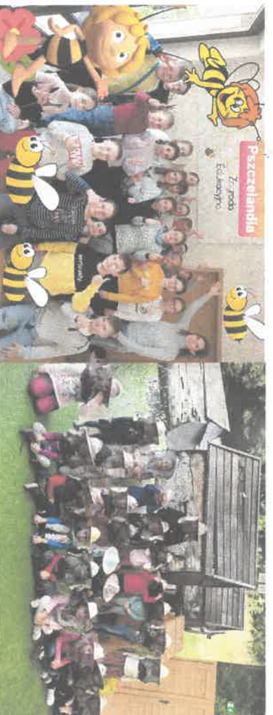
Fot. Małgorzata Pucer. Grupy warsztatowe.