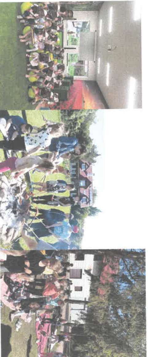
Uczestnicy warsztatów.

Właściciele twierdzą, że innowacje to ich klucz do sukcesu. W swojej pracy wykorzystują najnowocześniejsze rozwiązania biznesowe z zakresu organizacji i zarządzania, wprowadzają także różne nowości. Robią to po to, by zapewnić sprawną i efektywną pracę całego zespołu, sprostać krótkim terminom realizacji oraz sprawić, aby wszystkie potrzeby i wymagania klientów były zaspokojone. A to, w obecnych czasach, naprawdę niełatwe.