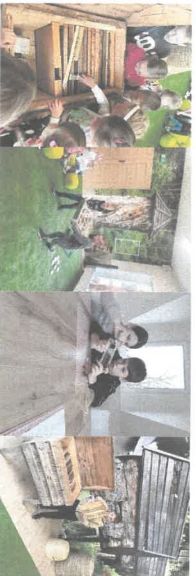
Warsztaty „Zielony listek”.

W latach 2021-2022 r. Małgorzata Pucer ukończyła I w Polsce Seminarium z apiterapii co pozwoliło rozszerzyć ofertę o nowe warsztaty kierowane do młodzieży oraz dorosłych. Apiterapia, czyli jak wspierać zdrowie i urodę produktami pszczelimi – to warsztaty podczas, których uczestnicy odwiedzają Pszczelnik, gdzie dowiadują się jak powstają produkty pszczele, przenoszą się w przestrzeń iluzji optycznych za pośrednictwem technologii 3 D, bezpiecznie sprawdzają co się dzieje w ulu, poznają się z historię bartnictwa, rolę pszczoły w przyrodzie. W części warsztatowej poznają produkty pszczele oraz ich wpływ na zdrowie i urodę. Dowiadują się jak w łatwy sposób w domu korzystać z dobrodziejstw z pszczelej apteki oraz własnoręcznie wykonują balsam do ust lub krem, który zabierają ze sobą do domu.