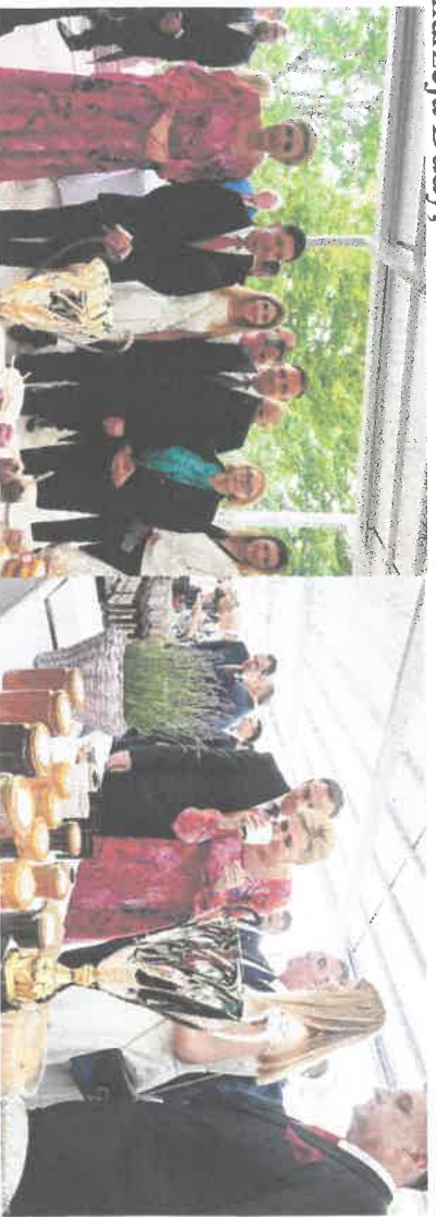
Pałac prezydencki- odbiór nagrody I Vice Mistrz krajowy Agroliga 2020.

- Pszczelandia to najlepsze miejsce na Warmii i Mazurach do relaksu na wsi w duchu słow life! Pszczelandia otrzymała I miejsce w konkursie Agro-Eko-Turystyczne Zielone Lato 2021 w kategorii Zagrody Edukacyjne.