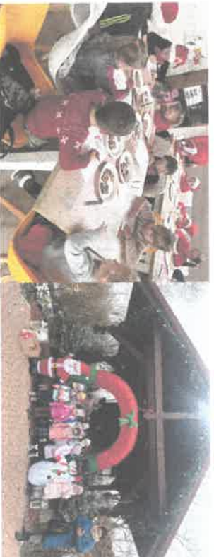
Warsztaty „Miodowe Mikołajki”.

Prowadzone działania publikowane są na Facebooku na profilu i Instagramie na profilu: