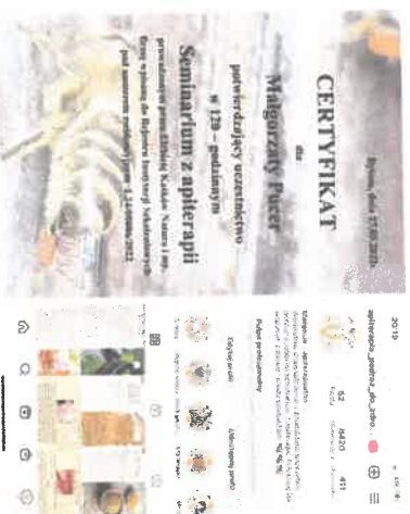
Certyfikat i rzut ekranu konta z IG”.

Edukacja związana jest ze zdrową żywnością, zdrowym życiem, ekologią, jest to niezwykle aktualny, modny i rozwijający się trend Slow Life, na który jest duży popyt. Ponadto gospodarstwo jest jedynym producentem certyfikowanego miodu ekologicznego w województwie warmińsko-mazurskim , co sprawia że właściciele mogą prowadzić edukację w tym zakresie, a żadna z zagród edukacyjnych w zakresie pszczelarstwa nie ma takiej ścieżki edukacyjnej.