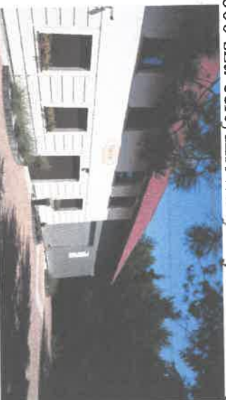
Budynek zakładu konfekcjonowania miodu.

W 2018 r. całkowita produkcja rolna na obszarze ponad 19 ha całkowicie została przestawiona na metody ekologiczne. W 2019 roku założono sad jabłoni ekologicznych. Nieużytek w o wielkości 1 ha został przywrócony do produkcji rolnej i posadzono 1600 szt. certyfikowanych jabłoni ekologicznych.