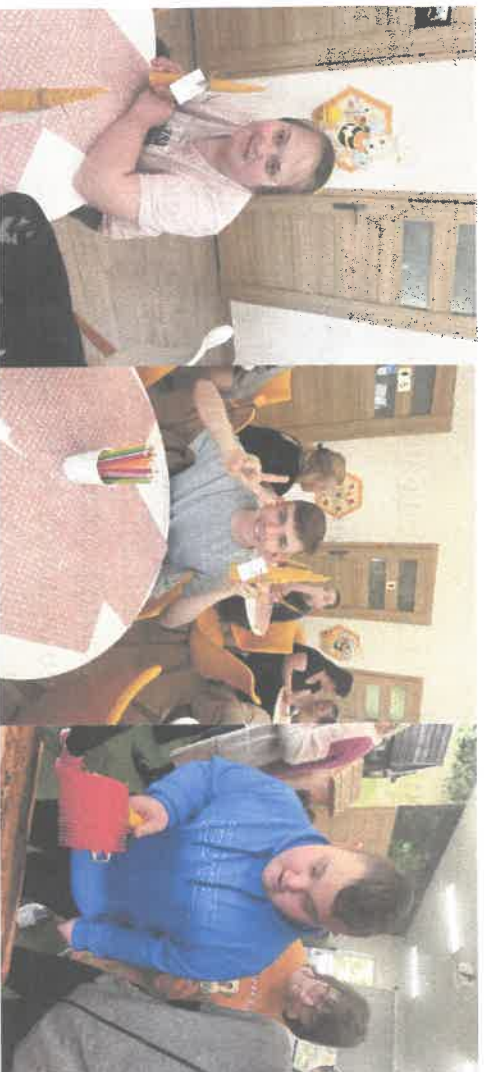
Fot. Małgorzata Pucer. Uczestnicy warsztatów.

Nauka podawana jest w formie zabawy, uczestnicy wszystkiego, dotykają, wachają, burzą, składają i rozkładają ule, w bezpieczny sposób wykonują czynności jakich wykonuje pszczelarz w pasiece, przez co lepiej zapamiętują podawane informacje.