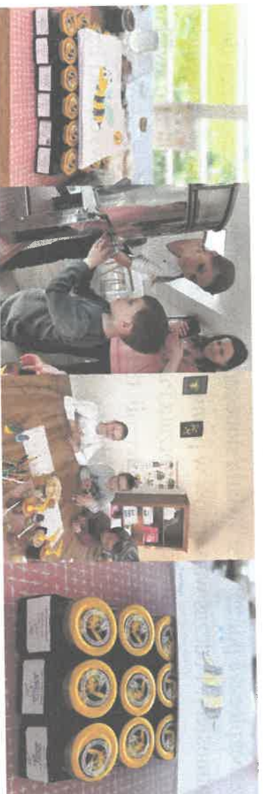
Warsztaty „Złota kropla miodu”.

- Złota kropla miodu to program w którym uczestnicy poznają produkty pszczele i ich walory zdrowotne, dowiadują się na czym polega różnica między miodami konwencjonalnymi a ekologicznymi co oznacza logo tzw. „zielonego listka”. Na koniec uczestnicy samodzielnie napełniają słóiczek miodu, na którym przyklejają osobście zaprojektowaną i wykonaną etykietę zgodną z obowiązującymi w tym zakresie przepisami;