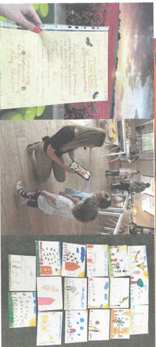
Podziękowania od uczestników warsztatów.

Zagroda Edukacyjna Pszczelandia jest świetnym przykładem poprawy warunków życia, zatrzymania mieszkańców, cyfryzacji, rozwoju kapitału społecznego zwiększenia dochodów, świadczenia usług i wzmocnienia potencjału społecznego, co znacząco poprawia jakość życia na wsi. Pszczelandia zapewnia nowoczesne rozwiązania dla szkół.