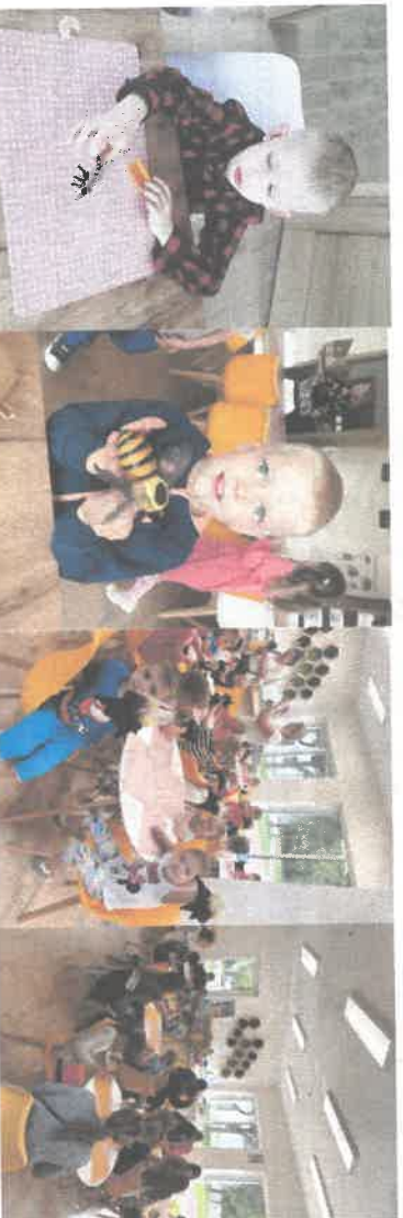
Warsztaty „Wielka przygoda z małą pszczolą”.

- Wielka przygoda z małą pszczolą podczas której uczestnicy odwiedzają Pszczelnik, gdzie przenoszą się w przestrzeń iluzji optycznych za pośrednictwem technologii 3 D, bezpiecznie sprawdzają co się dzieje w ulu, poznają historię bartnictwa, prace sezonowe w pasiece, narzędzia pasieczne oraz rolę pszczół i dowiadują się jak należy chronić naturalne środowisko tych pracowitych owadów, poznają produkty pszczele, oraz własnoręcznie wykonują świece z wosku pszczelego;